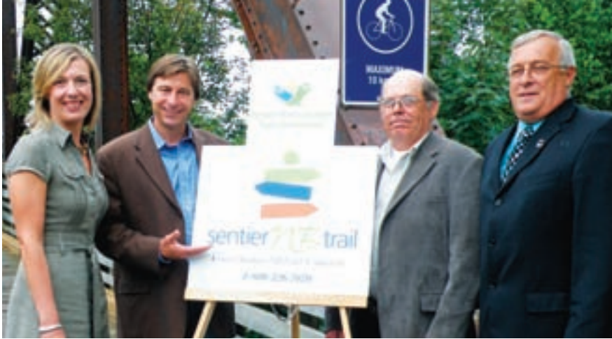
Table ronde sur le leadership national des sentiers

Les sentiers du Canada réunissent un vaste éventail d'organisations nationales, provinciales et locales, des groupes d'utilisateurs, gouvernements, bâtisseurs de sentier bénévoles et utilisateurs de sentier – chacun ayant une expertise, une expérience et des intérêts uniques.