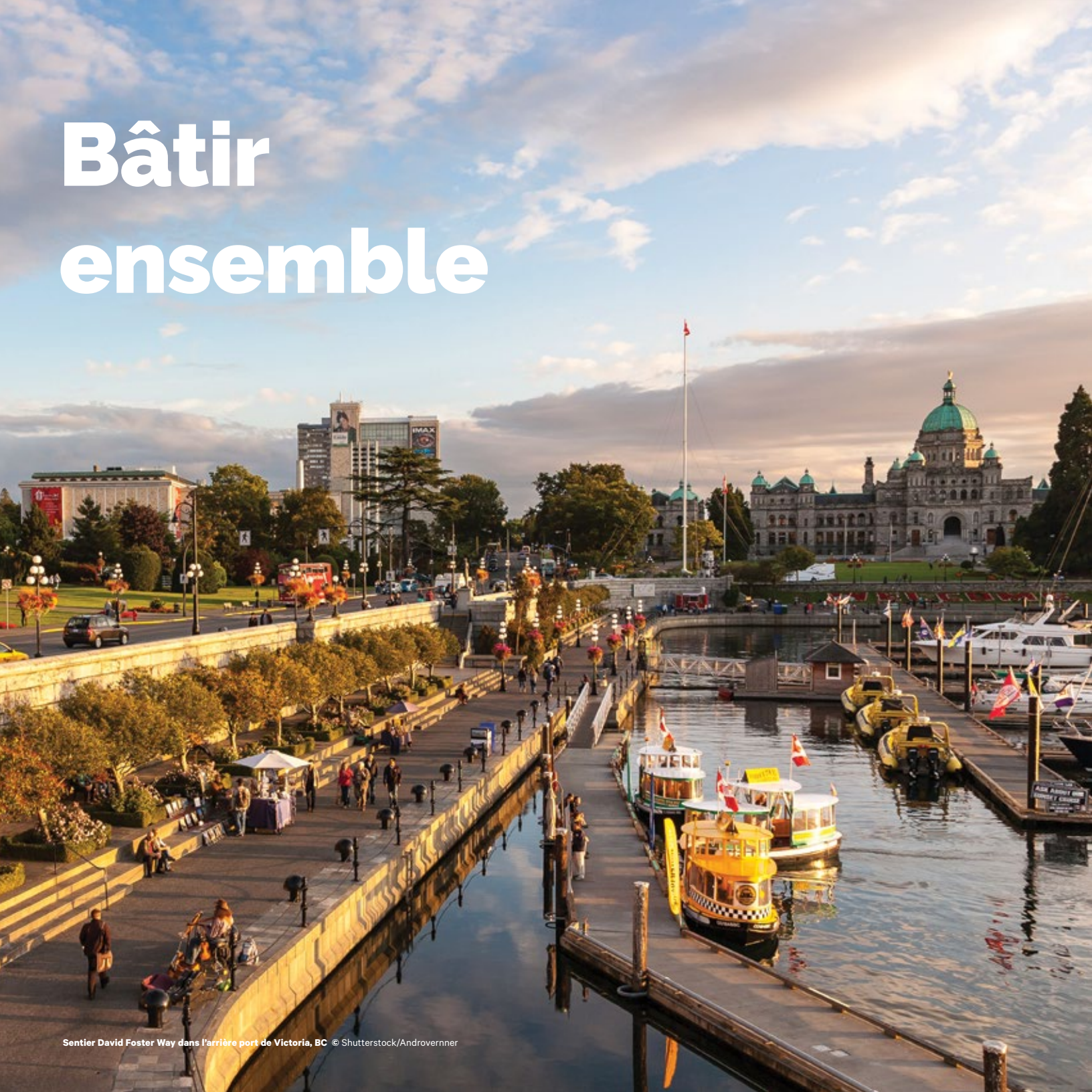
Sentier David Foster Way dans l'arrière port de Victoria, BC

Qu'une contribution provienne d'une famille, d'une société ou d'une fondation, une constante subsiste: le désir de créer le sentier le plus long du monde au bénéfice des Canadiens et des visiteurs. Nous vous présentons ici deux de ces précieux contributeurs, profondément convaincus que le Grand Sentier en vaut la peine, et fiers de renforcer son patrimoine, tout comme leurs pairs philanthropes.