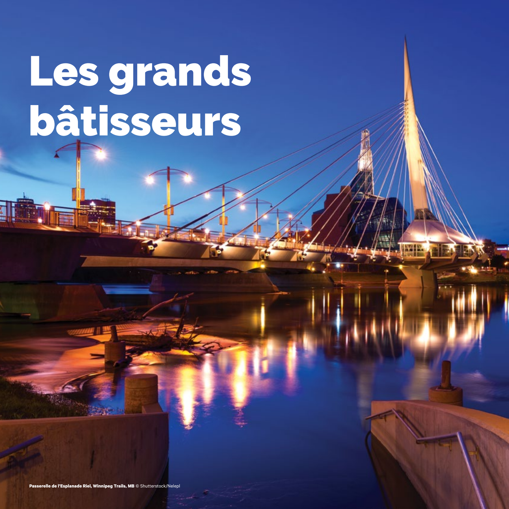
Passerelle de l'Esplanade Riel, Winnipeg Trails, MB

Ces partenaires du milieu des affaires — et beaucoup d'autres comme eux — partagent notre vision du Grand Sentier, un trésor à chérir pour les générations futures. Nous sommes heureux qu'ils investissent avec nous pour faire de ce rêve une réalité.