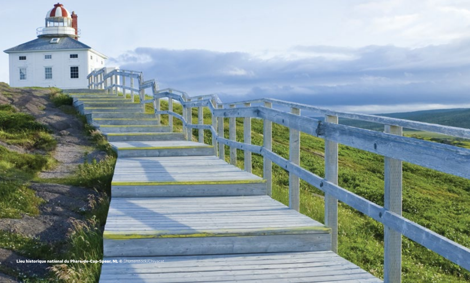
Lieu historique national du Phare de Cap-Spear, NL

Dans l'est du Canada, le Grand Sentier offre des possibilités pour toute une gamme d'activités. Les amateurs de plein air ont un accès relativement facile à quatre provinces uniques et à leurs tronçons distincts du Sentier. Bien qu'elles soient parmi nos provinces les plus petites, n'allez jamais dire qu'elles ne sont que de « petits morceaux » — les paysages que vous y trouverez sont aussi grandioses que diversifiés.