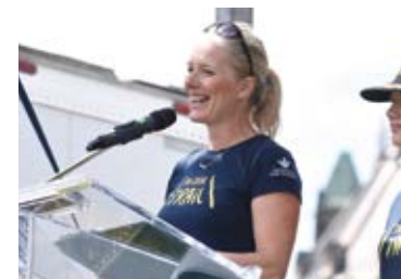
Photo: Catherine McKenna, ministre de l'Environnement et du Changement climatique.

1. Merci au gouvernement fédéral! Le gouvernement du Canada a réaffirmé son soutien continu à l'égard du Sentier en versant 30 millions $ supplémentaires, un support rendu possible grâce à notre partenariat fructueux avec Parcs Canada.